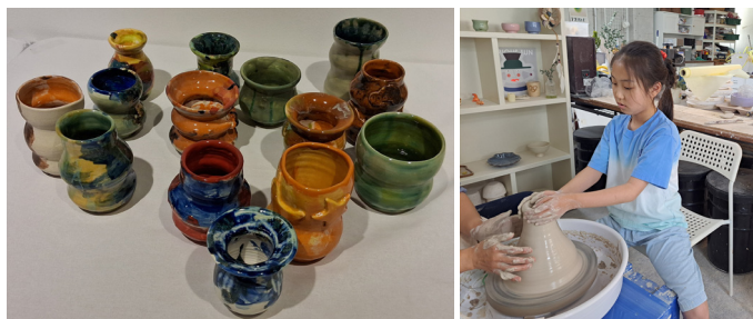
▲도기토끼팀의 작품 '깁(깨어남)'과 도자기를 만들고 있는 참여자.