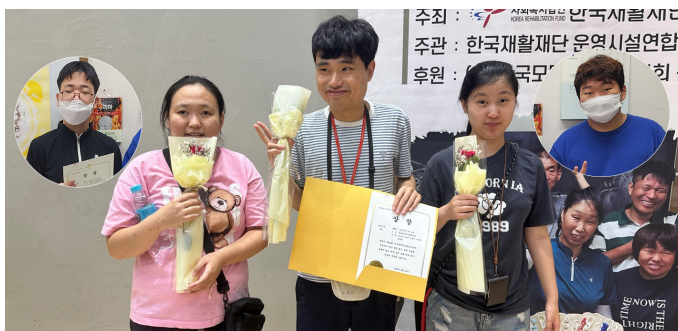
▲'그릇 위에 나의 마음' 작품으로 특선 수상한 오동통대학 참여자들.

한 명의 사회복지사로 바로 서기 위해 묵묵히 준비하고 있는 두 실습생들에게 많은 응원과 격려 부탁드립니다.