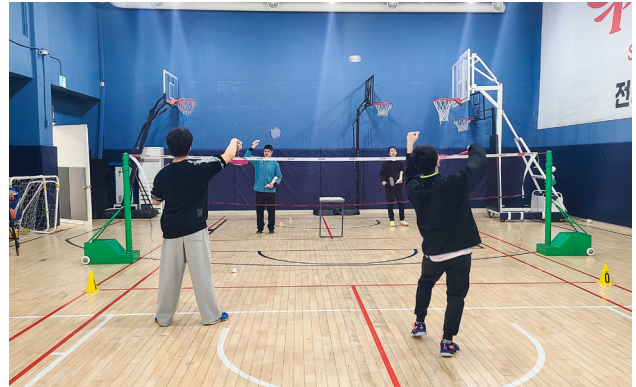
▲ 훈련에 임하고 있는 참여자들.

참가자들은 훈련기간 동안 거의 매일 함께 모여 전문 지도자의 체계적인 지도를 받으며 배드민턴의 기본 동작부터 차근차근 훈련했습니다. 라켓을 쥐는 법부터 팀 워크까지