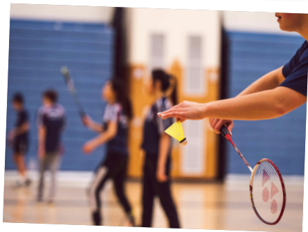
*이해를 돕기 위한 예시사진입니다.

건강해짐의 또 다른 신규 운동 프로그램 '편안한운동교실'입니다. 편안한운동교실은 '편마비 장애인의 신체를 편안하게 만든다'는 의미로, 장노년 뇌병변 장애인을 위한 프로그램입니다. 장애 특성과 신체 상태를 이해하는 과정부터 적절한 운동 방법까지 전문적으로 지도하며 참여자들이 자신의 몸을 객관적으로 바라보고 관리할 수 있도록 돕고 있습니다.